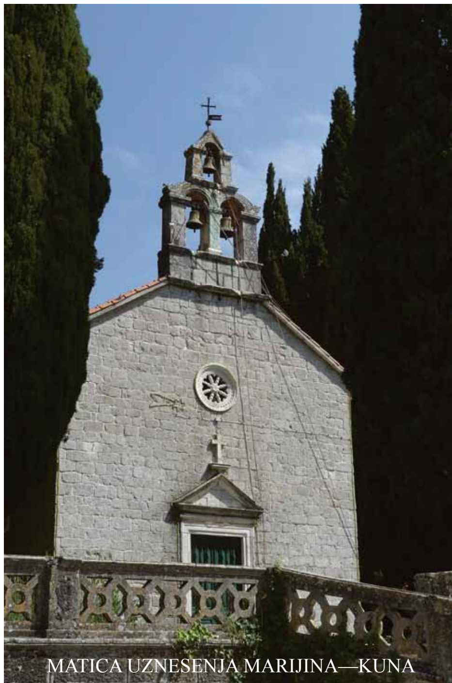
MATICA UZNESENJA MARIJINA—KUNA