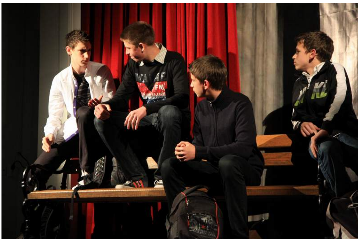
Četvorica mladića su izveli igokaz „Pjesmu starog samostana“ od Fra Ive Peran