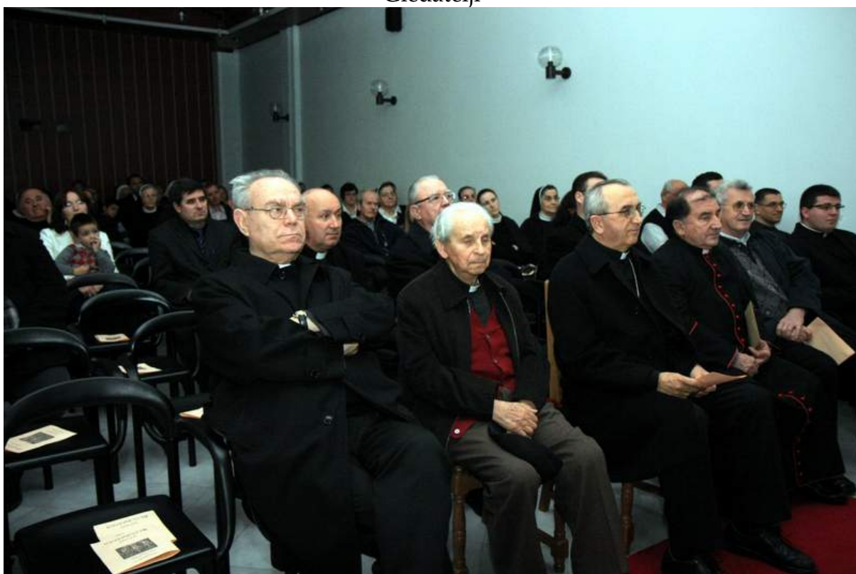
Među gledateljima je bio i nadbiskup Želimir Puljić