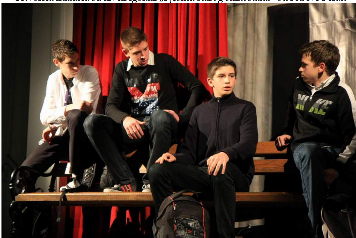
Četvorica mladića su izveli igokaz „Pjesmu starog samostana“ od Fra Ive Peran